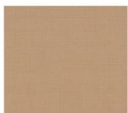
BS14 beige ベージュ Mansel value(マンセル値) (H)7.37YR(V)6.62(C)3.47 透光率 3%