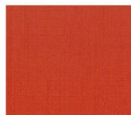
BS16 red レッド Mansel value(マンセル値) (H)5.22R(V)4.62(C)13.16 透光率 12%