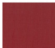
BS17 cardinal red カーディナルレッド Mansel value(マンセル値) (H)2.93R(V)3.82(C)8.97 透光率 9%