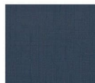
BS19 navy ネイビー Mansel value(マンセル値) (H)6.17PB(V)2.87(C)3.24 透光率 1%未満