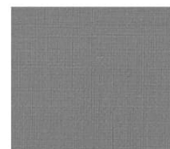
BS27 silver gray シルバーグレー Mansel value(マンセル値) (H)2.22PB(V)5.80(C)0.48 透光率 1%未満