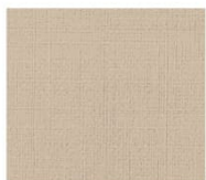
BS13 beige ベージュ Mansel value(マンセル値) (H)7.85YR(V)8.27(C)1.52 透光率 6%