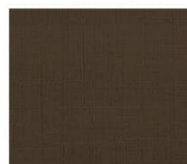
BS15 dark brown ダークブラウン Mansel value(マンセル値) (H)0.43YR(V)2.96(C)0.82 透光率 1%未満