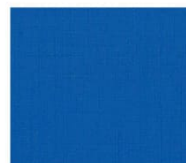
BS23 blue ブルー Mansel value(マンセル値) (H)5.0PB(V)3.7(C)10.7 透光率 1%未満