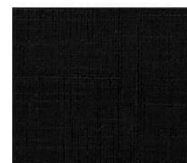
BS20 black ブラック Mansel value(マンセル値) (H)4.05PB(V)2.50(C)0.21 透光率 1%未満