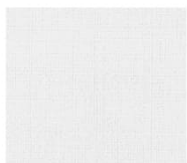
BS11 white ホワイト Mansel value(マンセル値) (H)1.34G(V)9.51(C)0.55 透光率 10%

■材 質 / ガラス繊維100%+強化ビニル ■不燃材料認定番号 / NM-3086 ■防炎製品認定番号 / F-23018 ■規 格 / 102cm×50m乱 ■表 面 処 理 / フッ素樹脂コート加工