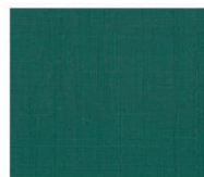
BS18 deep green ディープグリーン Mansel value(マンセル値) (H)3.36BG(V)3.41(C)3.47 透光率 1%未満