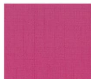
BS24 cherry pink チェリーピンク Mansel value(マンセル値) (H)7.2RP(V)4.7(C)13.7 透光率 14%