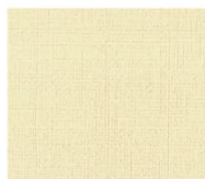
BS12 ivory アイボリー Mansel value(マンセル値) (H)3.72Y(V)9.26(C)3.32 透光率 13%