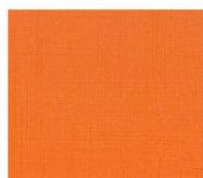
BS22 orange オレンジ Mansel value(マンセル値) (H)8.8R(V)5.9(C)15.6 透光率 17%