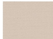
ミスト mist 透光率 6% Mansel value (マンセル値) (H)6.95YR(V)8.38(C)1.45