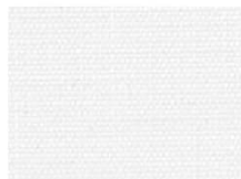
フロスト frost 透光率 11% Mansel value (マンセル値) (H)6.00Y(V)9.50(C)0.71

また、高周波ウエルダーやライスターなどによる溶着も可能です。(日本国特許 第3933639)「ラッシュ」はカンボウプラス株式会社の光触媒ライセンス技術を用いて開発した商品です。