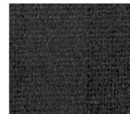
墨 sumi 透光率 10% Mansel value(マニセル値) 紫外線カット率 91% (H)6.41P(V)3.06(C)0.14