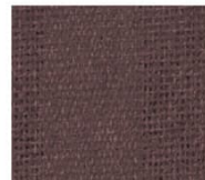
苔 azuki 透光率 10% Mansel value(マニセル値) 紫外線カット率 89% (H)1.56RP(V)3.72(C)1.51