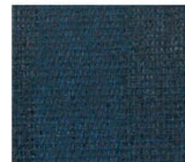
藍 ai 透光率 11% Mansel value(マニセル値) 紫外線カット率 87% (H)3.56PB(V)3.10(C)2.66