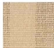
砂 suna 透光率 20% Mansel value(マニセル値) 紫外線カット率 92% (H)8.37YR(V)7.09(C)2.75