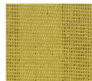
竹 take 透光率 16% Mansel value(マニセル値) 紫外線カット率 90% (H)9.29Y(V)6.54(C)5.65