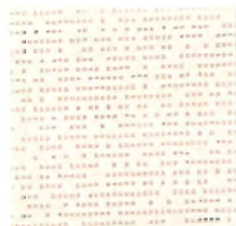
ナッツ nuts 透光率 21% 紫外線カット率 85%

Mansel value(マンセル値) (H)4.40Y(V)9.36(C)3.54