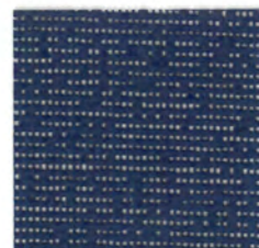
プルーン prune 透光率 13% 紫外線カット率 87%

Mansel value(マンセル値) (H)0.38PB(V)7.45(C)4.45