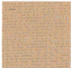
オーレ au lait 透光率 12% 紫外線カット率 89%

Mansel value(マンセル値) (H)5.99YR(V)8.49(C)1.78