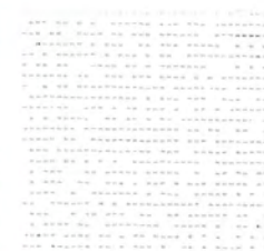
ミルク milk 透光率 21% 紫外線カット率 89%

Mansel value(マンセル値) (H)2.69BG(V)4.08(C)2.88