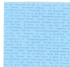
ソーダ soda 透光率 12% 紫外線カット率 89%

Mansel value(マンセル値) (H)0.5YR(V)2.9(C)1.2