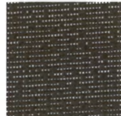
モカ mocha 透光率 14% 紫外線カット率 86%

Mansel value(マンセル値) (H)6.7YR(V)6.6(C)3.4