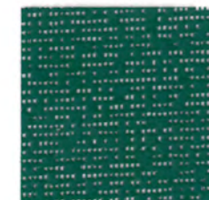
リーフ leaf 透光率 9% 紫外線カット率 91%

Mansel value(マンセル値) (H)2.00B(V)7.79(C)4.21